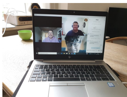
Et typisk eksempel på et online møde i forretningsudvalget i Furesø Lærerkreds under nedlukningen.

Vi er i Furesø Lærerkreds i gang med at samle alle de erfaringer vi har og bruge dem konstruktivt i dialog med Byråd og forvaltning, når vi taler skoleudvikling i de kommende år.